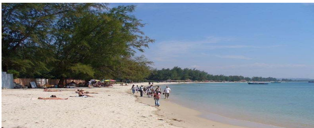
Plage de Serendipity à Sihanoukville

Petite ville provinciale, elle est vouée à un développement touristique important. Ses grandes plages de sable blanc font le bonheur des familles khmères alors que les touristes occidentaux partent pour la plongée autour de ses îles luxuriantes.