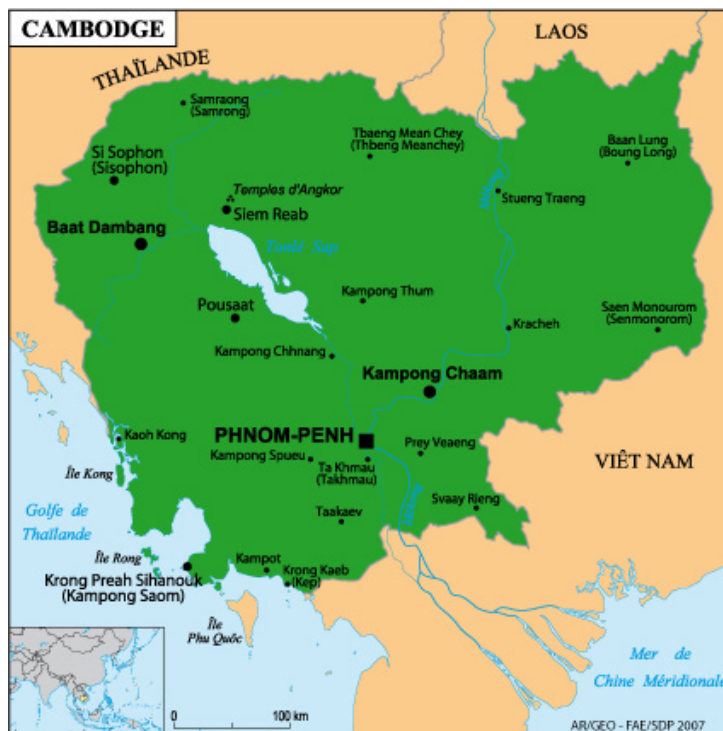
Carte 1 – Localisation et accessibilité de Sihanoukville