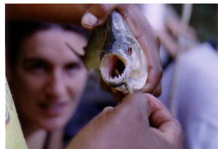
Pêche aux piranhas