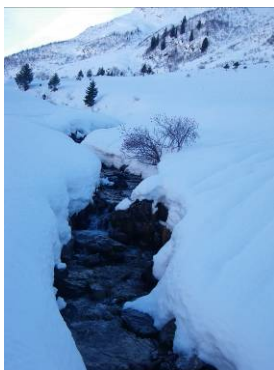
Source de montagne